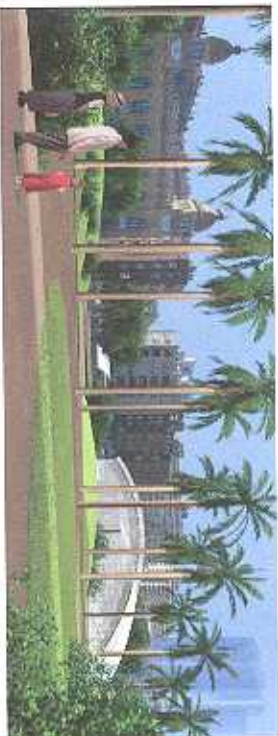
VISTA PEATONAL SUR (ORIENTATIVA)