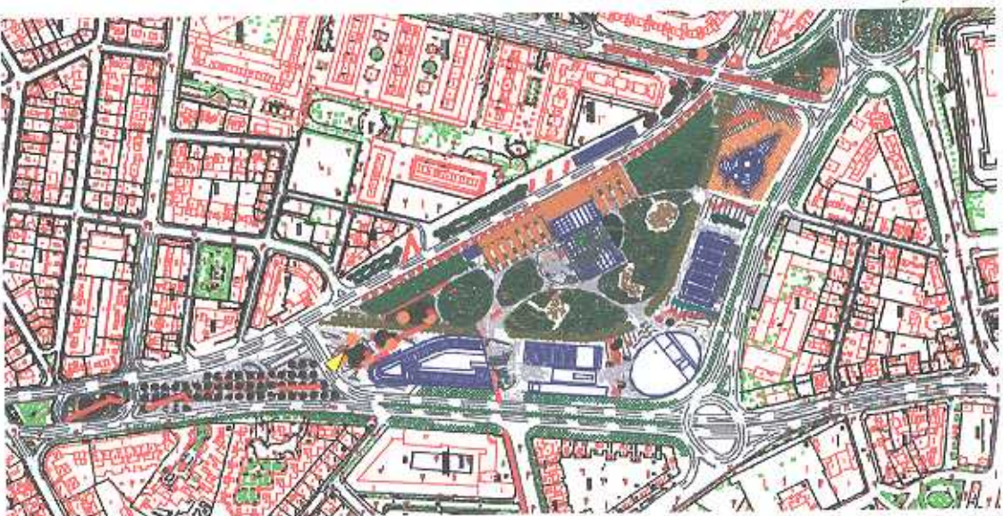
PLANTA DE IMAGEN