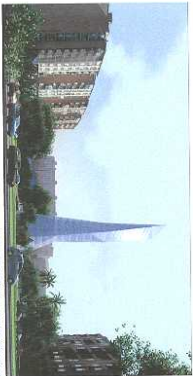
VISTA PEATONAL NORTE (ORIENTATIVA)